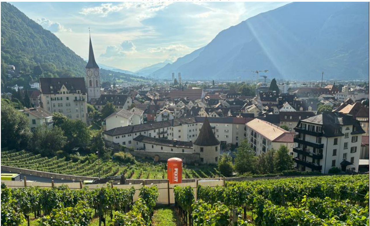
Ausblick über die Stadt Chur

Nach der Gebetszeit begeben wir uns zur Freien Christengemeinde (FCG) in Chur an der Wiesentalstrasse 7. Dort lassen wir den Anlass mit Kaffee und Kuchen (bis ca. 16.30 Uhr) ausklingen.